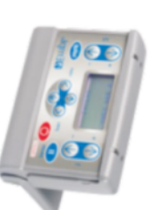
ARTROSTIM FOCUS PLUS

Serwis i całodobowa pomoc techniczna: tel. 501 483 637 service@kalmed.com.pl