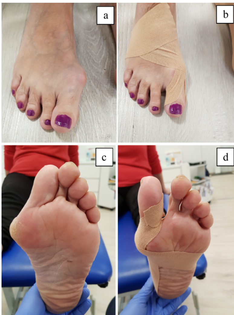
Figure 2. Patient's foot before the application of Kinesiology Taping, view from the dorsal (a) and plantar (c) sides, and from the dorsal (b) and plantar (d) sides after application